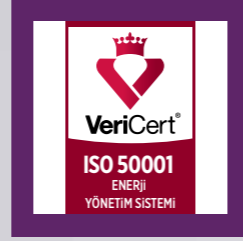
ISO 50001 Belgesi Enerji Yönetim Standardı Onayı