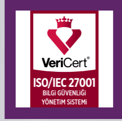
ISO 27001 Belgesi Bilgi Güvenliği Yönetim Standardı Onayı