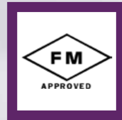
FM Onayı Ürünün Kalite, Teknik Bütünlük ve Performans Standartlarını Karşılması Onayı